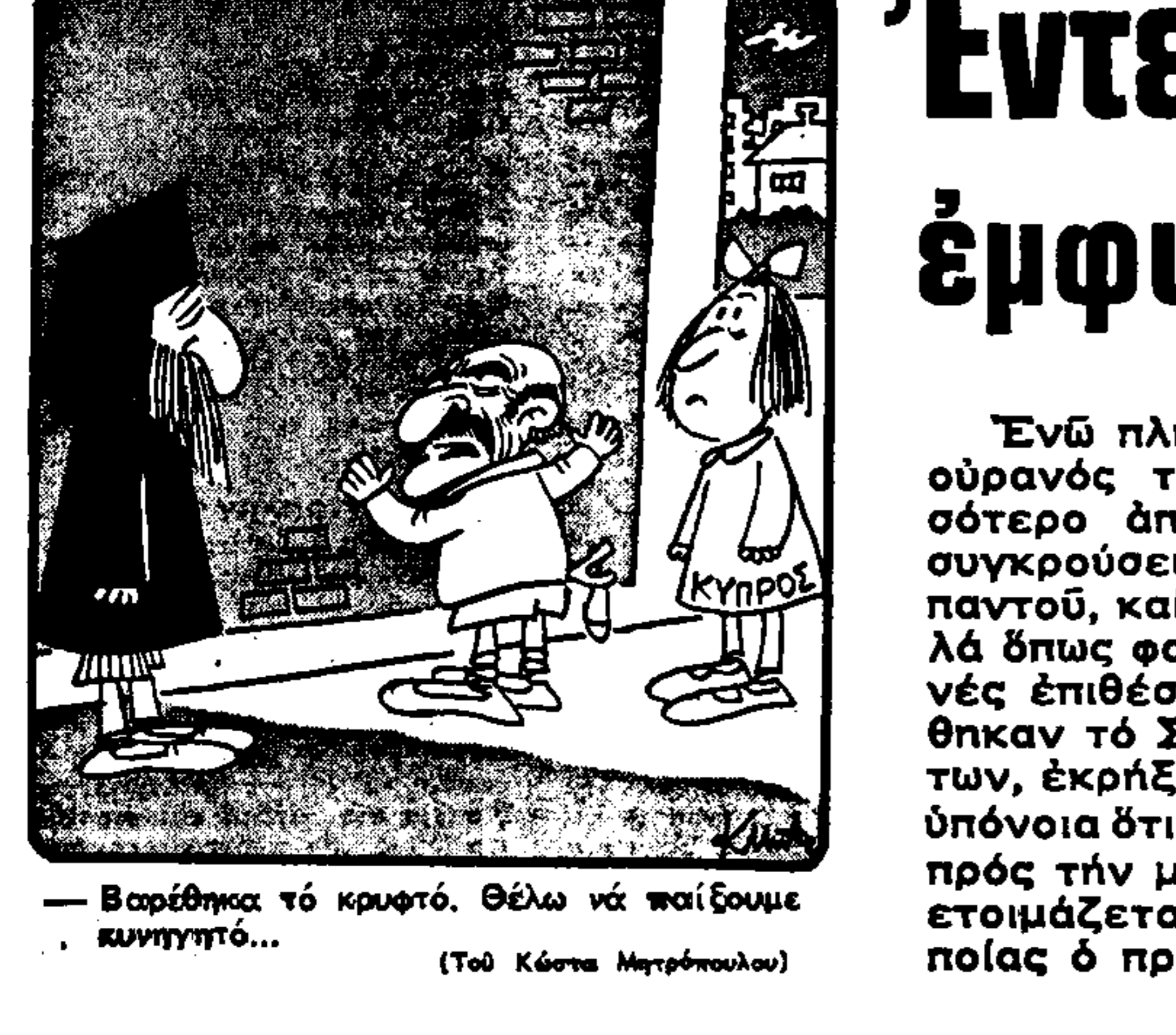
Βαρειότερο τό κρυφτό, θέλω νά παίξουμε κυνηγιό...

Ευθυμια καί σοβαρά ΓΡΙΠΠΙΩΝΤΕΣ Τού ΔΗΜ. ΨΑΘΑ